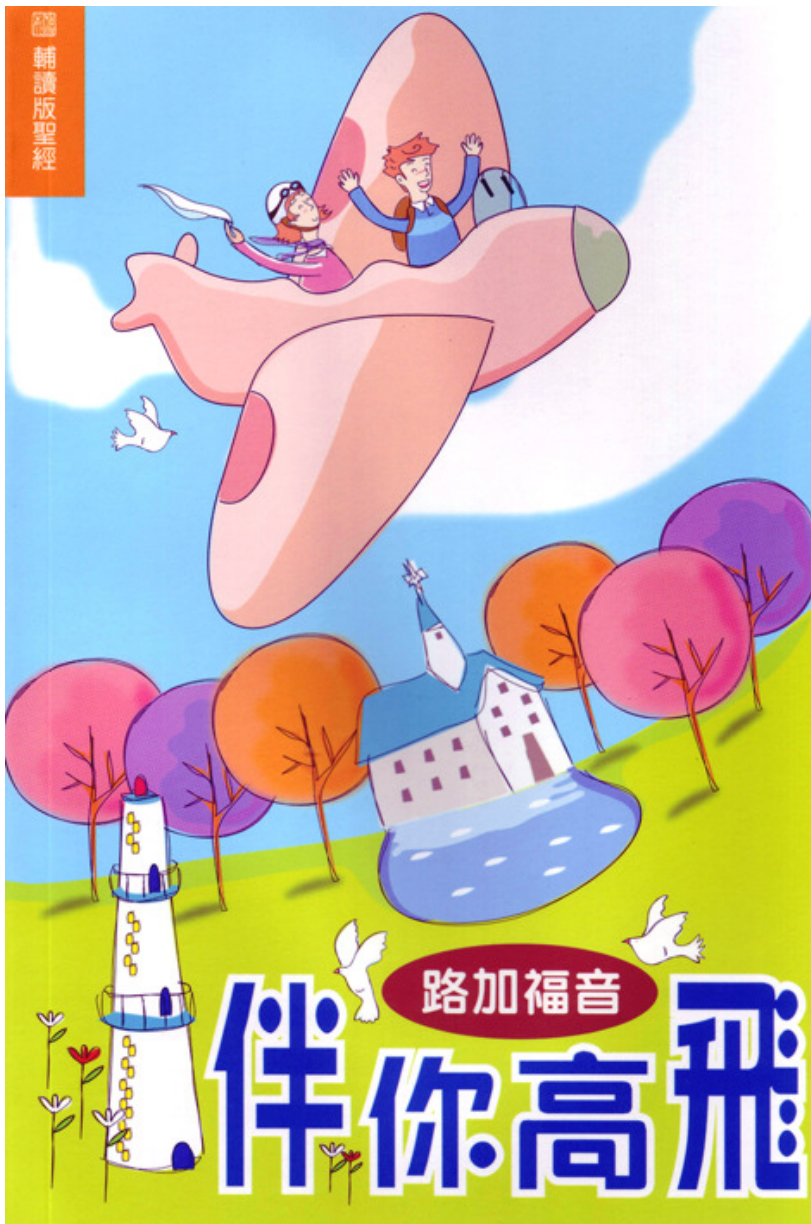
14-15 年度 Sun Pilot 運動 大會指定材料 《伴你高飛》輔讀版聖經